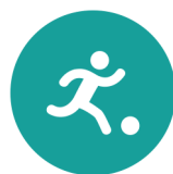
Spel en beweging/ bewegingsonderwijs